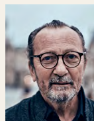
PAOLO ROVERSI Photographe de mode à la renommée internationale